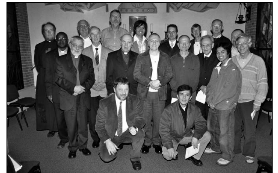
Nederlandse en Duitse Camillianen bij elkaar ter gelegenheid van de hereniging.